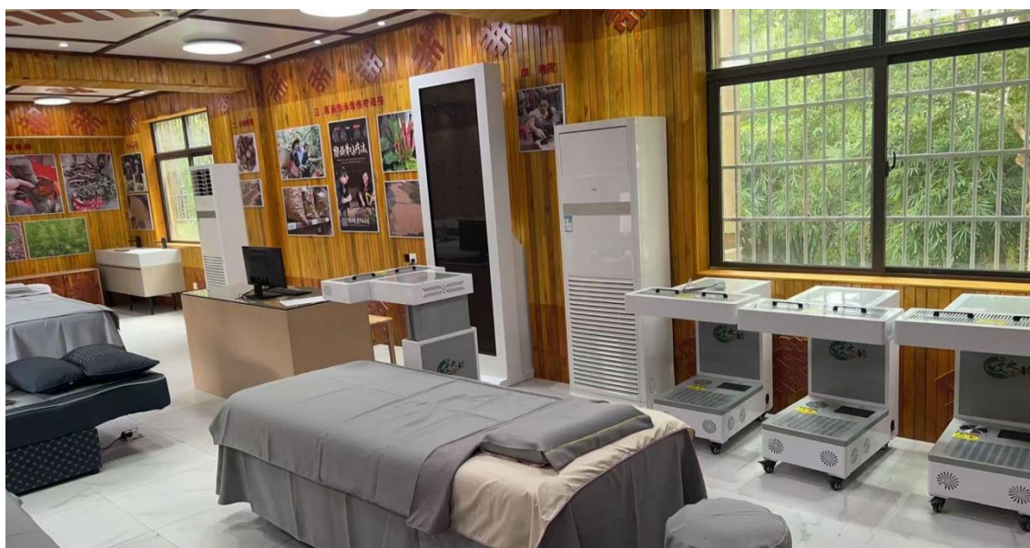
图19 学校（老校区）民族医药与康养护理实训室

随着国家“健康中国2030”战略的深入推进和海南省建设国际旅游消费中心、打造康养旅游目的地的发展定位，社会对高素质技术技能型康养护理人才的需求日益增长。同时，海南作为多民族聚居省份，拥有丰富的黎族、苗族等少数民族传统医药资源，为了加强民族医药的传承、创新与应用。学校作为省内重要的民族职业教育基地，肩负着培养民族地区实用型技术人才的重要使命。为适应新时代职业教育高质量发展要求，提升民族医药与康养护理专业人才培养质量，在老校区建设功能完善、设备先进、贴近岗位实际的专业实训室。