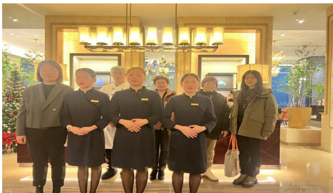
图 22 专业教师深入企业开展走访实习生

覆盖汽车运用与维修、新能源汽车运用与维修、电气设备运行与控制、旅游服务与管理、电子商务、计算机应用、美发与形象设计、会计事务等 8 个专业、23 个班级。实习合作单位包括通力电梯有限公司、珠海纳思达股份有限公司、宁波密度美业美容美发有限公司、海南车友汇汽车维修服务有限公司、海口荷泰酒店、三亚亚龙湾希尔顿大酒店、三亚美高梅度假酒店等 64 家企业，实习地域主要分布于海南、上海、广东等地，形成立足本省、辐射重点区域的实习布局。