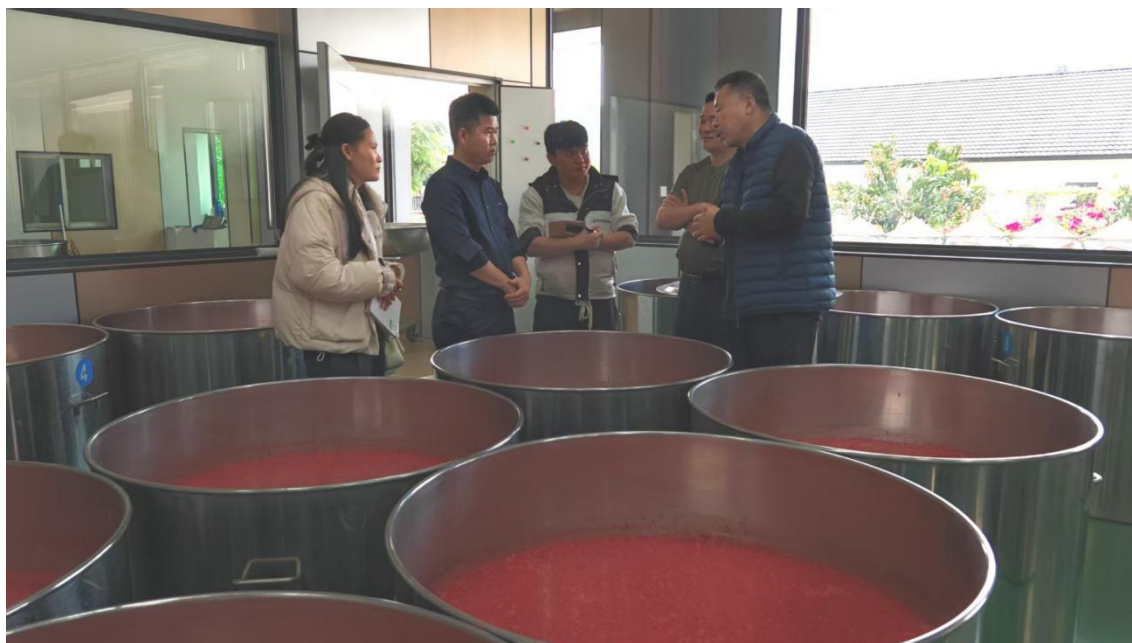
图 18 走进企业考察学习

学校教师主动走出校园，深入产业一线，赴海南山兰酒庄有限公司开展实地考察与学习，深入了解企业真实生产流程、技术标准和岗位能力要求，并将这些鲜活的产业元素有机融入课程内容与教学设计中，有效提升了理实一体化课程的针对性、实用性与前瞻性，切实服务区域经济社会高质量发展。