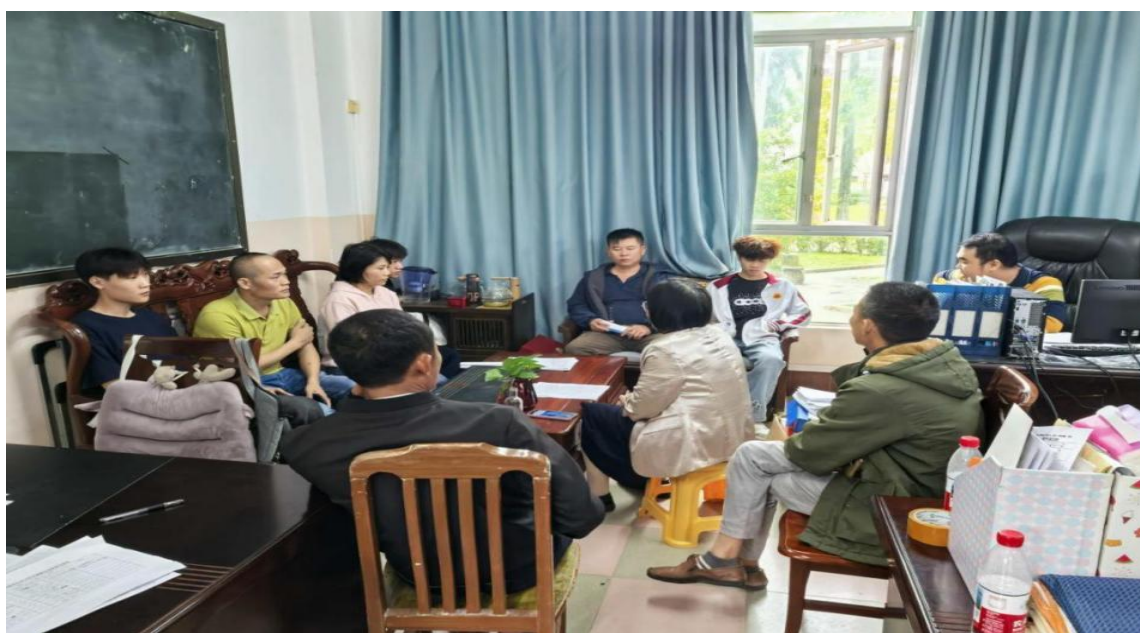
图 4 学生科有关工作人员与学生家长共同交流