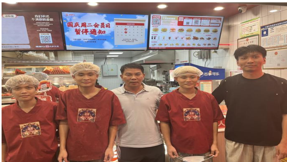
图 21 校领导与专业教师走访在江苏的实习生

拓展实习岗位。 为保障学生岗位实习顺利开展，学校严格实施企业前置考察机制。每年1月至3月，由校领导、专业教师及班主任组成的考察小组深入企业实地评估，重点考察企业资质、岗位环境、专业匹配度、薪资福利及食宿安全等要素，确保实习单位优质可靠。2025年，学校共组织23级全日制827名学生赴企业参加岗位实习，