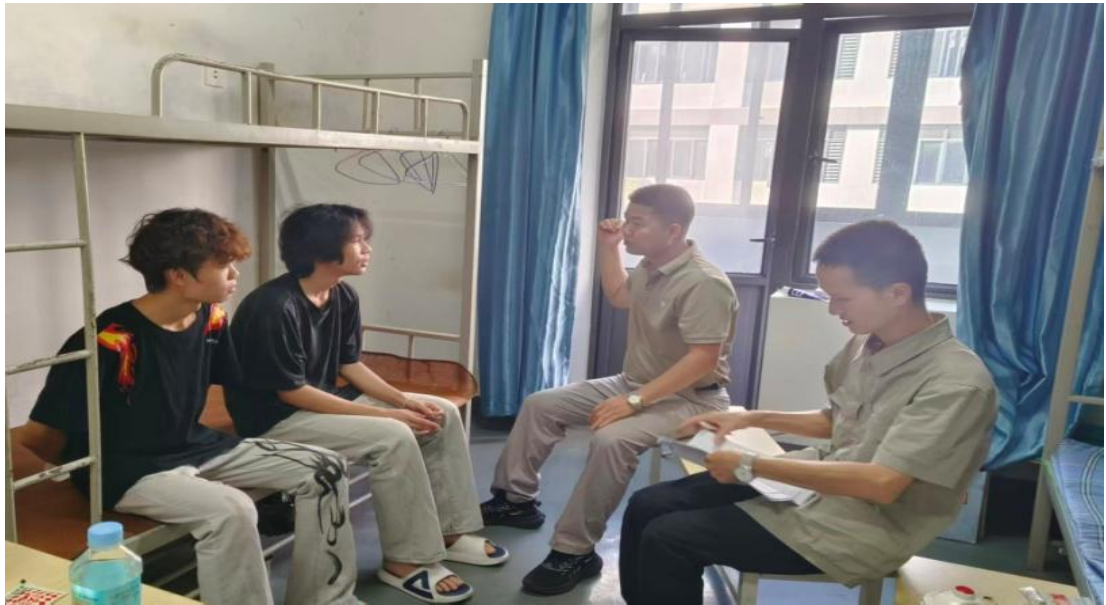
图 25 校领导走访在上海的实习生

学生安全管理。 学校坚持“安全第一、预防为主”原则，构建全员参与、全程覆盖、全面排查的学生安全管理体系，切实维护校园安全稳定。一是加强值班值守，落实全员管理实行校领导带班、中层干部、学管人员及班主任共同参与的 24 小时值班制度，形成多级联动管理机制，确保学生各类问题及时响应、有效处置。二是完善请假制度，实现全程跟踪，严格执行学生离校家长请假及“到家报告”制度，对外出学生实施时间管控与班主任动态跟踪，确保学生离校期间安全管理不断线。三是强化安全教育，常态排查隐患。重点开展宿舍安全与违禁品排查，严禁存放易燃易爆物、大功率电器、管制刀具等物品。建立“班主任每周自查、派出所每月联查”机制，及时消除安全隐患，增强学生安全意识，维护宿舍与校园安全。