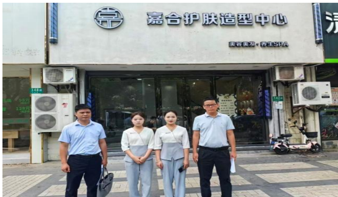
图 24 组织专业教师及班主任深入企业开展走访实习生

实现毕业生定向输送至合作企业。同步推进订单学徒制项目，以企业真实生产任务为载体，引导学生以学徒身份参与实践，同步完成理论学习，强化技能积累与职业适应能力，打造具有示范效应的校企协同育人模式。