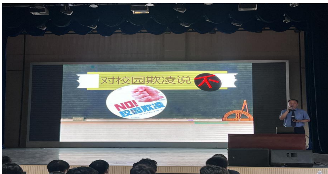
图 3 法制副校长到校宣讲安全教育

题班会 42 次，内容全面覆盖爱国主义、安全法治、心理健康、职业规划等核心主题，确保德育方向统一、内容扎实。同时鼓励各班级结合专业特点开展自主班会，学年内班级平均开展 5 次，形成“统一导向、个性拓展”的生动格局。班会形式持续创新，广泛采用案例研讨、情景模拟、辩论与实践体验等互动方式，显著提升学生参与感，促进德育内化于心、外化于行。此外，全年举办校级专题讲座 16 场，内容聚焦五大领域：爱国主义教育（3 场）、法治安全（5 场）、青春健康（4 场）、职业规划（3 场）及环境保护（1 场）。讲座邀请校外专家、行业精英及法治副校长等主讲，为学生提供前沿、实用的知识与理念，有效拓宽认知视野，强化育人实效。