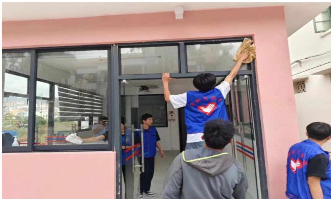
图8 开展校内劳动实践课