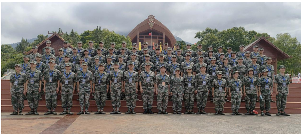
图 17 民兵预备学生役参加“三月三”活动安保工作

学校承担着加强国防教育的重要使命，是增强公民国防观念、提高公民国防素质的基础工程和中心环节。学校在上级领导的指导下，立足南海国防建设，开展国防特色教育，学校的预备役和民兵应急分队自成立至今，已有 1330 名学生加入队伍，在组织学生参与国防教育和国防建设的过程中，储备大量的国防后备力量，参加过预备役和民兵的学生，毕业后踊跃报名应征入伍，直接为部队输送了优质的兵员，至今共有 118 人参军和参加消防员，目前了解到的有一名参加驻港部队，有 2 名先后表现突出荣立三等功。被中央军委授予“国防教育示范学校”荣誉称号。