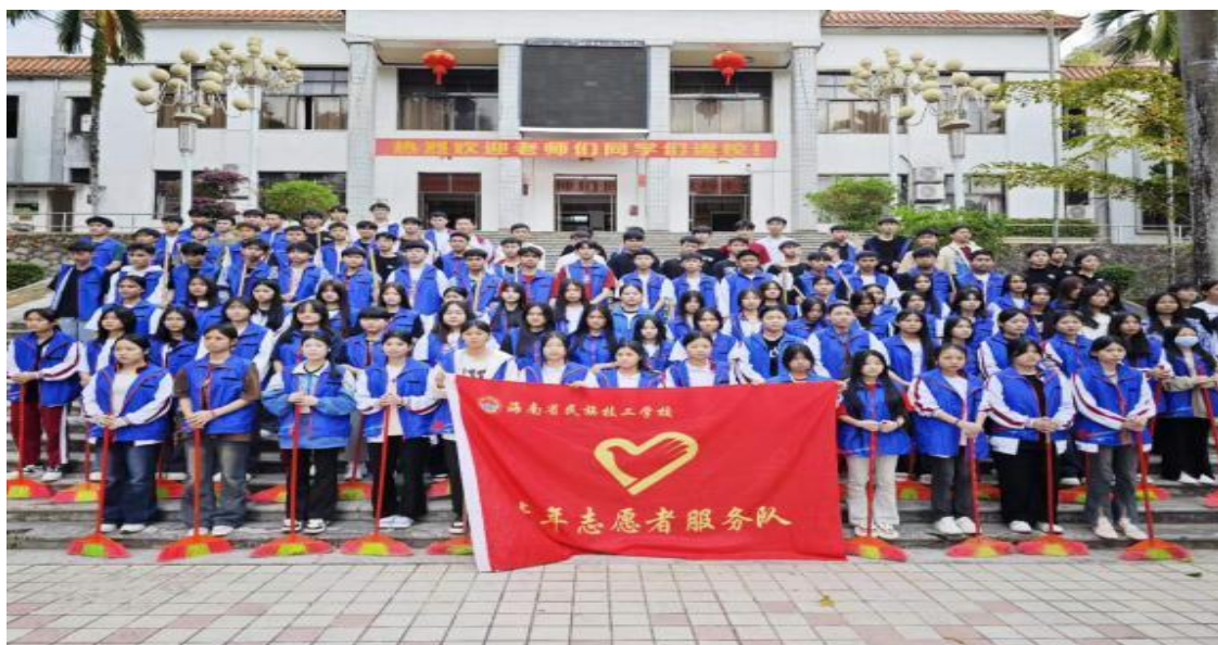
图9 开展志愿者活动