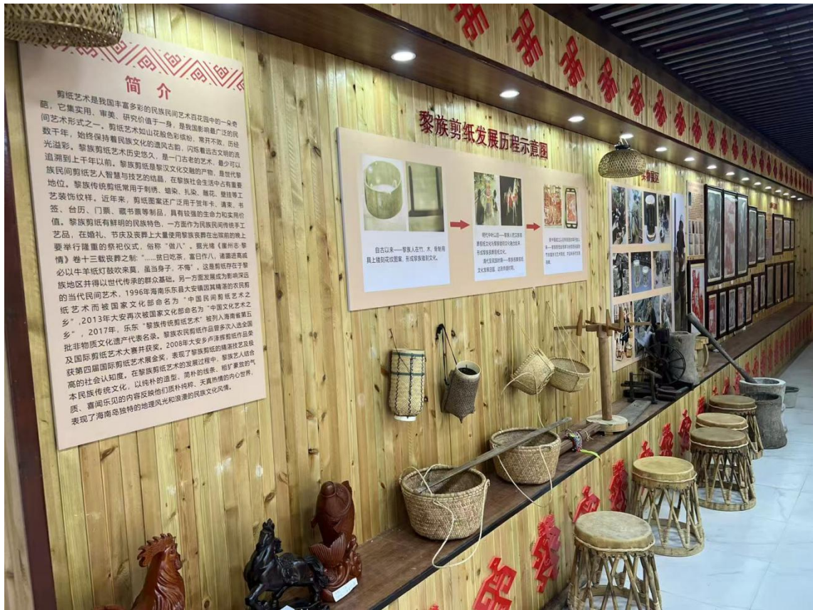
图 12 民族美术专业展览馆