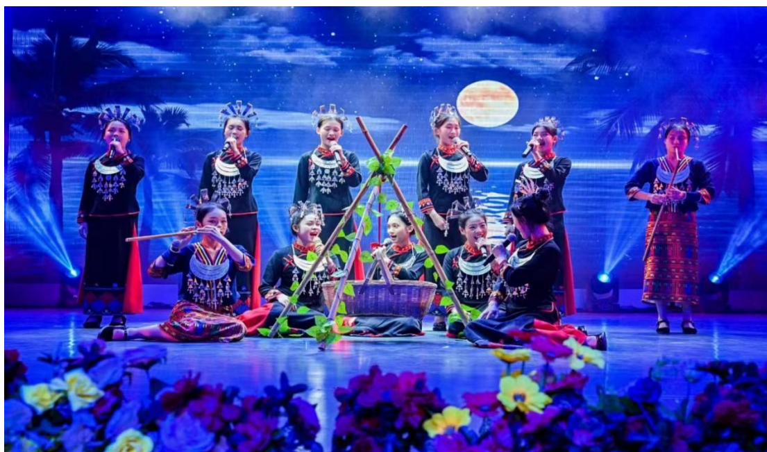
图 15 学校艺术团汇报演出