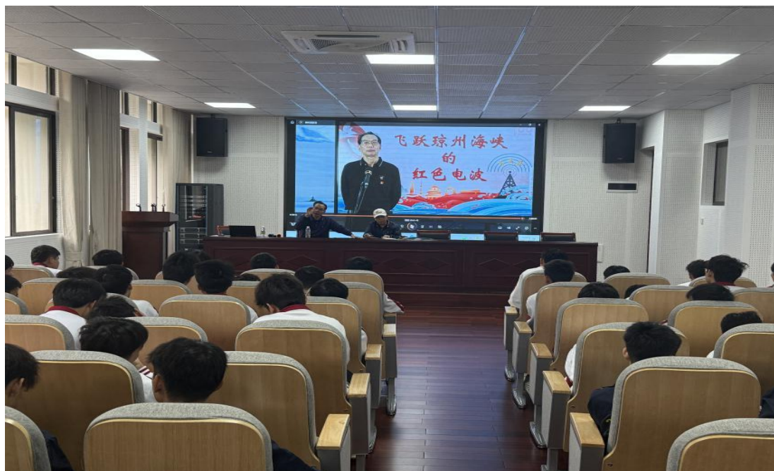
图1 革命后代到校宣讲革命先辈英雄事迹

学校秉持“管理即服务、服务即育人”的理念，将品德塑造渗透于日常管理与服务全过程，以暖心服务传递价值导向，以规范管理涵养良好品行。每年新生入学期间，组织开展叠被子、整内务等训练，夯实宿舍文明建设基础。同时，注重培养学生的社会公德与安全意识，引导学生理解“爱人爱己、互帮互助”的精神内涵，在关爱他人、奉献社会的同时，增强自我保护能力，掌握助人且确保安全的方法。