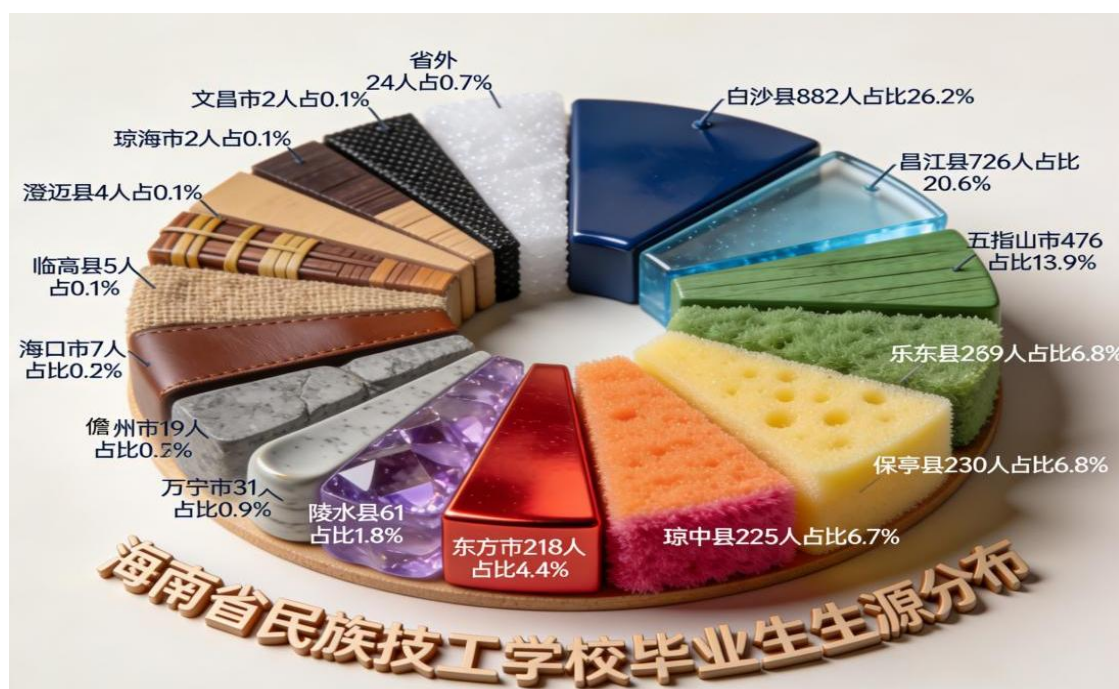
表 2 2025 年毕业生生源分析

毕业生就业去向。 截至 2025 年 7 月 1 日，学校毕业生就业率达 93%，其中协议（合同）就业占比 92%，升学占比 8%。就业流向与海南自贸港重点产业高度契合，毕业生对岗位适应性良好。