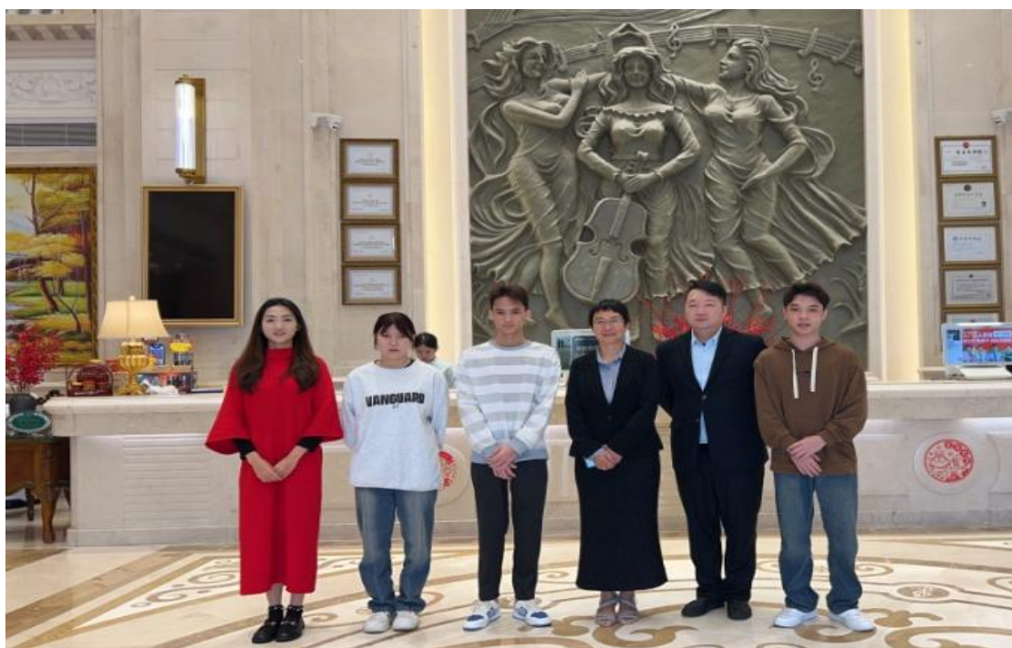
图 23 校领导与专业教师走访实习生

始终保持打扫数量与抽检质量双优，同样荣获优秀实习生称号。两位同学以扎实的技能、细致的服务和高度的责任心，在实习岗位上展现出优秀的职业素养与团队精神，赢得了企业与客户的一致认可。她们的表现不仅为个人职业生涯奠定坚实基础，也为学校树立了良好的社会声誉，发挥了积极的榜样带动作用。