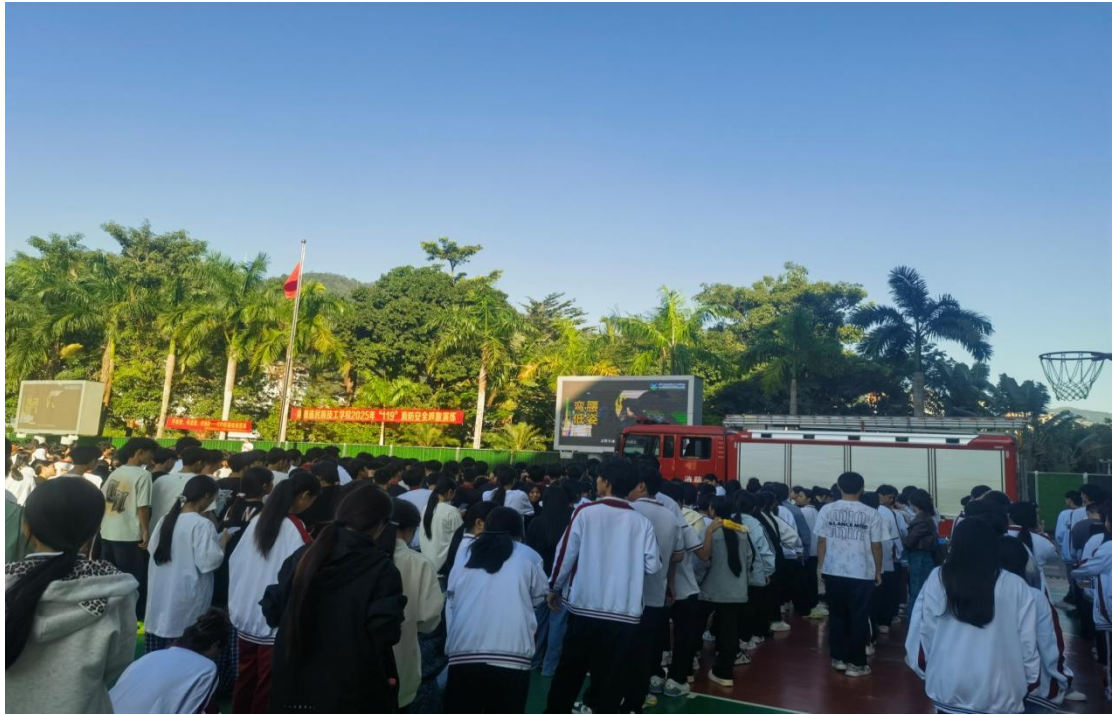
图 26 学校与企业共同举办消防主题培训

实验实训室安全管理。 学校高度重视实验实训室安全工作，坚持“安全第一、综合治理”方针，全面落实安全管理责任，完善工作机制，着力提升师生安全素养，切实防范安全事故发生，保障校园安全稳定和师生生命财产安全。通过明确责任分工、强化安全教育、常态开展隐患排查与应急演练，学校构建了“人人有责、层层落实”的安全管理体系，切实增强了相关人员的法治观念、安全意识和应急处置能力，确保实验实训教学安全、规范、有序开展。