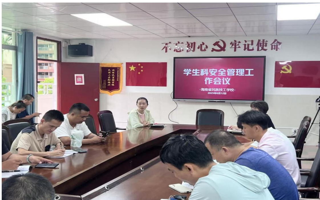
图 6 班主任安全管理工作会议