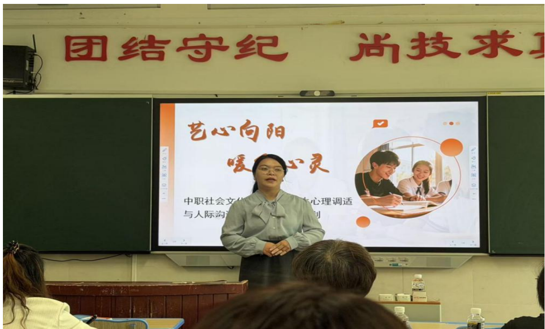
图 5 班主任能力大赛