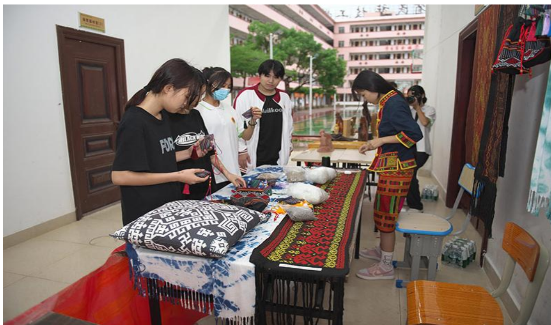
图 14 学生非遗作品制作展示

学校依托专业师资开设民族美术社区培训班，围绕美术创作、传统剪纸、手工雕刻等内容开展培训 15 期，覆盖社区居民 800 余人次。培训既帮助居民掌握实用技艺、丰富精神文化生活，也促进了本土民族美术的传承与普及，切实将技能服务延伸至社区基层。