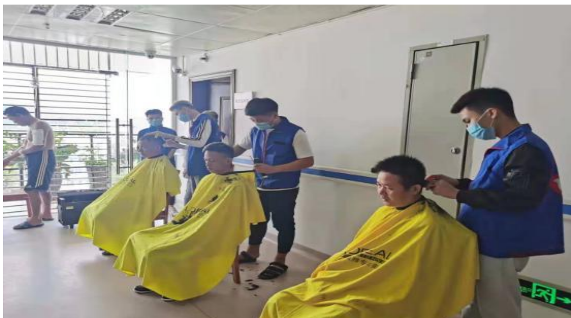
图 10 学生开展义剪活动