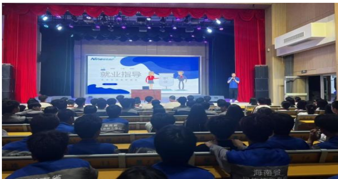
图 20 企业到校开展就业指导