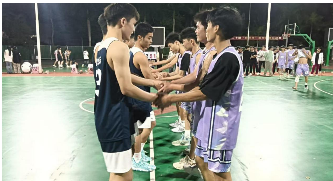
图 16 学校举行第二十届“迎新杯”篮球赛

组织新生进行第三届拔河比赛、二十届“迎新杯”篮球赛、第十三届排球比赛活动，大大提高班级凝聚力和组织力，展现了各班同学凝心聚力争夺荣誉、积极向上展现青春风采的精神面貌，同时也促进了同学之间的团结合作的团队精神，增强了各班同学的集体荣誉感。