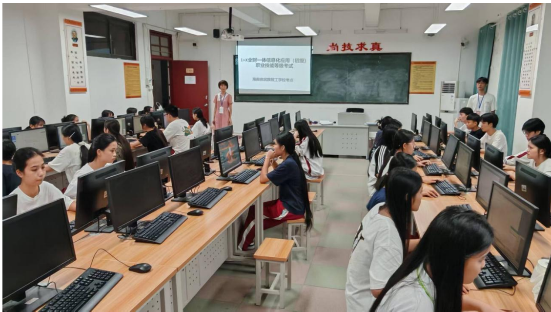
图 13 组织职业技能等级证书考试

以赛促教提升育人水平。 坚持“以赛促教、以赛促学”，2025 年师生在各类技能竞赛中表现突出：在全省教师赛中获一等奖 3 项、二等奖 4 项、三等奖 12 项；指导学生获省级二等奖 4 项、三等奖 12 项；在首届“冯诺依曼杯”国际职业技能挑战赛中获银奖 2 项，竞赛成绩持续突破，彰显学校技能人才培养成效。