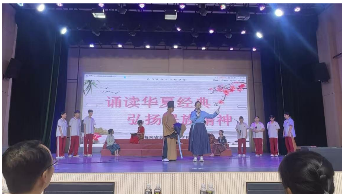
图 7 经典诵读比赛